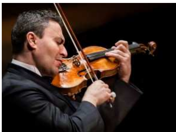
מאת שוש להב

אחרי ההצלחה בטוקיו, מקסים ונגרוב – כנר ומנצח, בשתי תוכניות בארץ, עם: שירה שקד – פסנתר, תזמורת האקדמיה מנוחין (שוויץ) והסימפונית הישראלית ראשון לציון והמנצח – ואג פפיאן. היכל התרבות ת"א: 19, 20 בספטמבר 2014